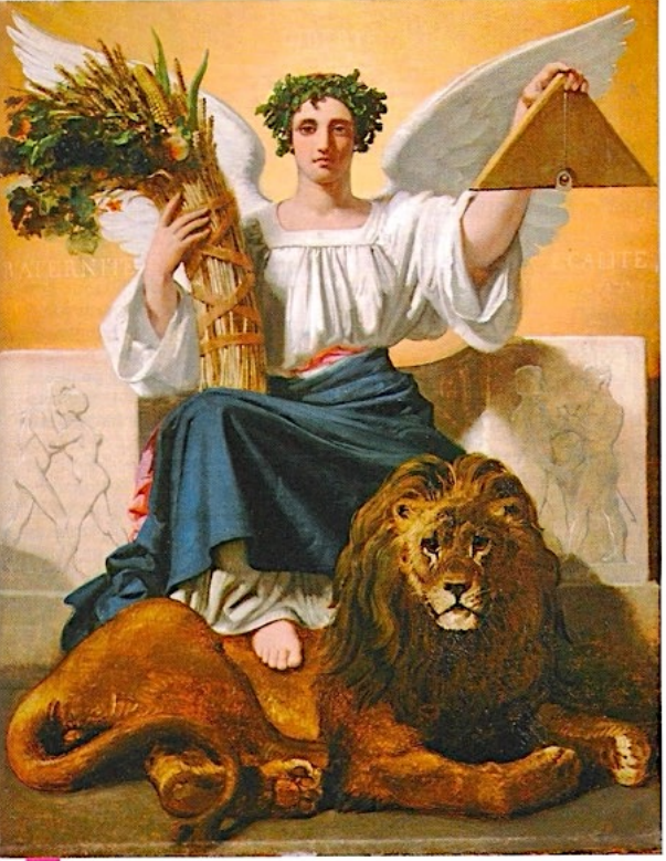
4 L'allégorie de la République Par cette toile, Jules Ziegler célèbre la République juste et sage, qui assure la prospérité et s'appuie sur la force du peuple. Jules-Claude Ziegler, La République , 1848, musée des Beaux-Arts, Lille.