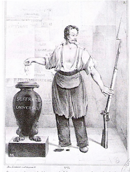
1 Le vote ou le fusil, la place nouvelle de l'élection au suffrage universel « Ça, c'est pour l'ennemi du dehors; pour le dedans, voilà comme l'on combat loyalement les adversaires... » Marie Louis Bosredon, Le Vote ou le Fusil , 1848, BnF, Paris.

CONSEILS Distinguez ce qui fait référence : -à la réactivation du projet de la Révolution française -aux réformes politiques -aux réformes sociales