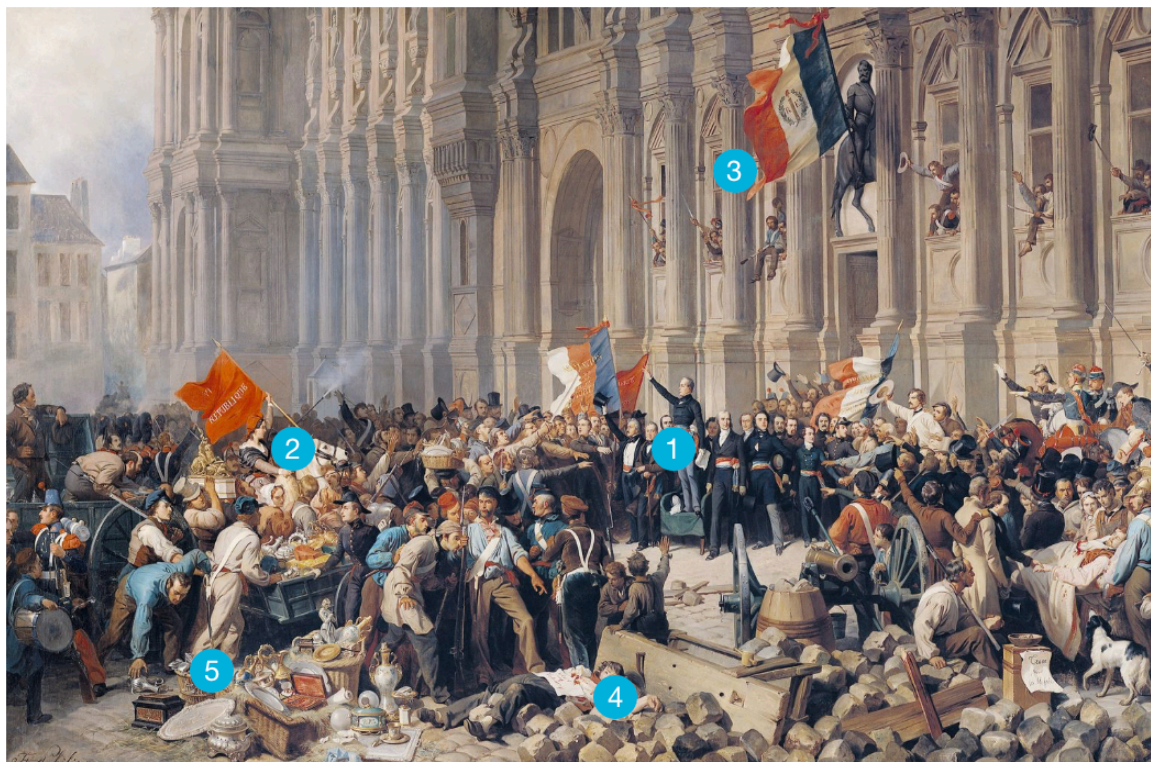
Félix Philippoteaux, Lamartine refusant le drapeau rouge devant l'Hôtel de ville , v. 1848, huile sur toile, 298 x 629 cm, musée du Petit Palais, Paris.